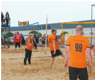
Jedes Jahr bei bema: das legendäre Beachvolleyballturnier

PREISTRÄGER Großer Preis des MITTELSTANDES