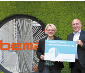
Ausgezeichnete Bonität: seit 2012 erfüllen wir die Kriterien