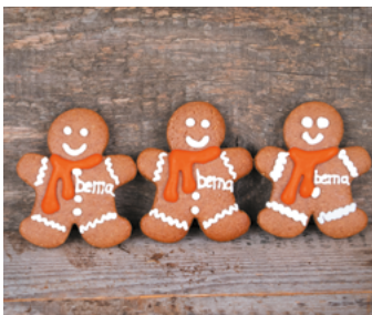
Ob Weihnachten oder Open-Air, wir feiern gemeinsam als bema-Team