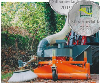
Silbermedaille 2019 & 2021 für das bema Saug-Kehrsysteem